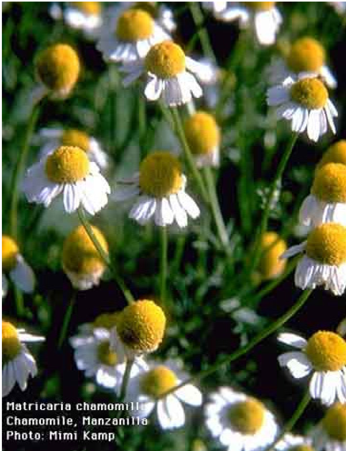
Matricaria chamomilla Chamomile, Manzanilla