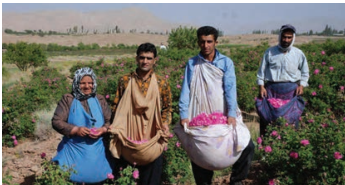
برداشت گل برای گلاب‌گیری