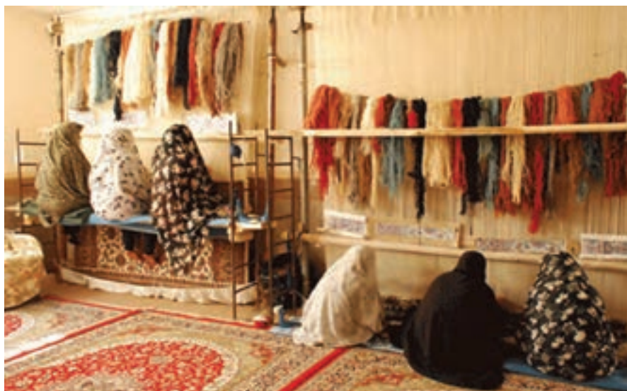
کارگاه فرش بافی (اشتغال و تولید)