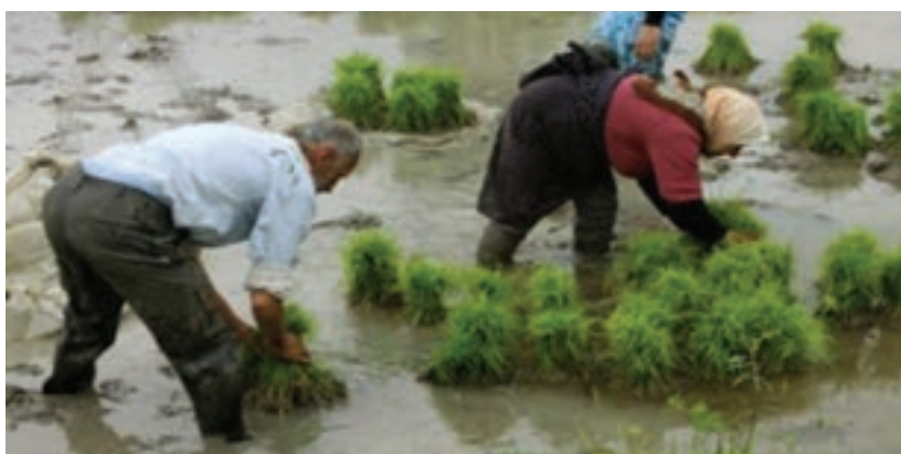
کار در شالیزار