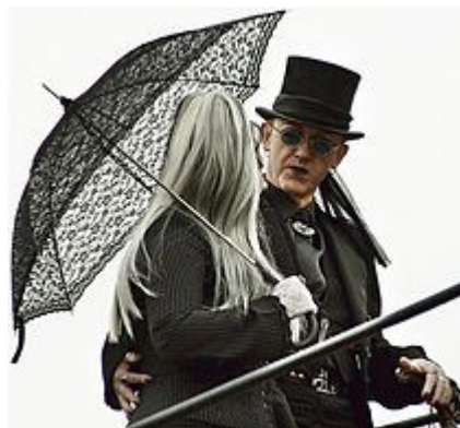
زن و مردی با پوشش گوتیک تصویر ۱۹

کاملاً سیاه، و یا سبک مو و آرایش منحصر به فرد آن شناخت. سایمون رینولدز راههای شناسایی این سبک را به شرح زیر بیان می کند: