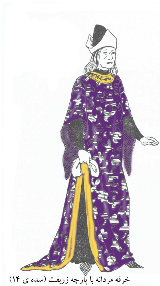
خرقه مردانه با پارچه زربفت (سده ی ۱۴)

خرقه: مردو زن خرقه ای فراخ ولی زیبا و مجلل داشتند که نوع مردانه آن درزی در جلو یا پشت داشت و از سر پوشیده می شد. نوع زنانه خرقه دارای دنباله ای طویل در پشت دامن بود..