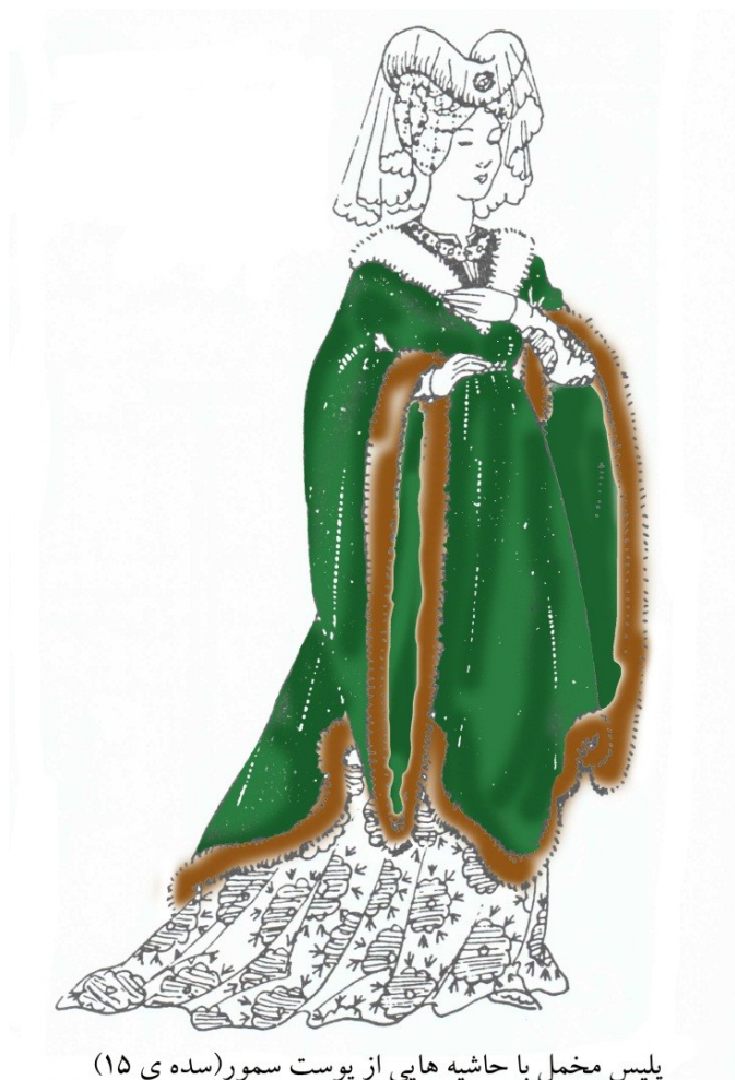
پلیس مخمل با حاشیه هایی از پوست سمور (سده ی ۱۵)

پلیس: پوششی نوین برای بانوان در سده ی دوازدهم. کت گشادی بود تا زانو که در جلو کمر با دگمه ای بسته می شد و آستینهایی فراخ داشت.