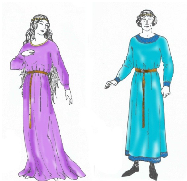
بلیاد یا پیراهن بلند با کمربند چرمین (سده ی ۱۲)

بلیاد: ۱ تونیکی آستین بلند که نوع زنانه آن تا روی پا و مردانه آن تا بالای زانو می رسید، که بعدها بلندتر و تا قوزک پای ایشان آمد. البته بلیاد مردانه باز هم کوتاه شد به طوریکه در قرن سیزدهم به سر زانو و بعد از آن کوتاه تر شد و تنها اندکی پایین تر از کمر را پوشاند.