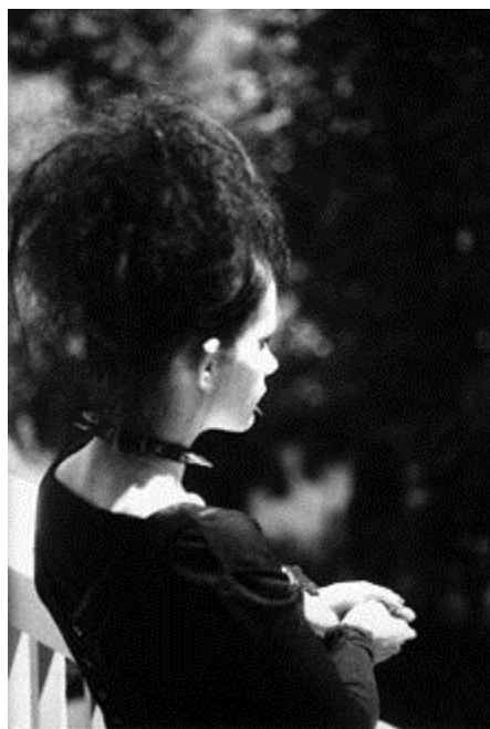
دختری با ظاهر گوتیک تصویر ۱۸

سبک گوتیک شامل رنگ کردن مو به رنگ سیاه، موجدار کردن مو، لبهای سیاه و لباسهای سیاه است. در طراحی این سبک از ویژگیهای سبک پانک، ویکتوریایی و الیزابتی بهره گرفته شده است.