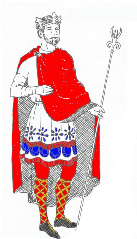
جوراب شلواری با بند جوراب ضربدري (سده ی ۱۰)