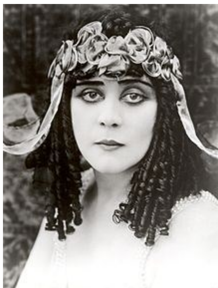
ثدا بارا- از مشاهیر گوتیک تصویر ۲۰

از مدلهای معروف این سبک به ثدابارا، مرزیدورا، بلالاگوس، بتی پیچ و... می توان اشاره کرد.