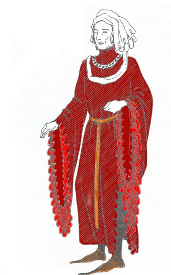
هوپلند با کفش و کمر بند چرمین (سده ی ۱۴)

هوپ لند: ۷ شل بزرگی که زنان می پوشیدند، نوع زمستانی آن آستری از خز داشت؛ و ردای مردانه ای بلند، فراخ و یقه دار با آستینهای گشاد با کمر بندی چرمی یا جواهر نشان.