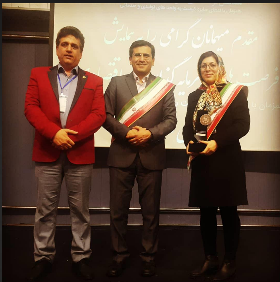
سمینار کشف فرصت های شغلی