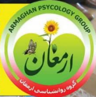
سمینار مدیریت انگیزه و تعهد کاری