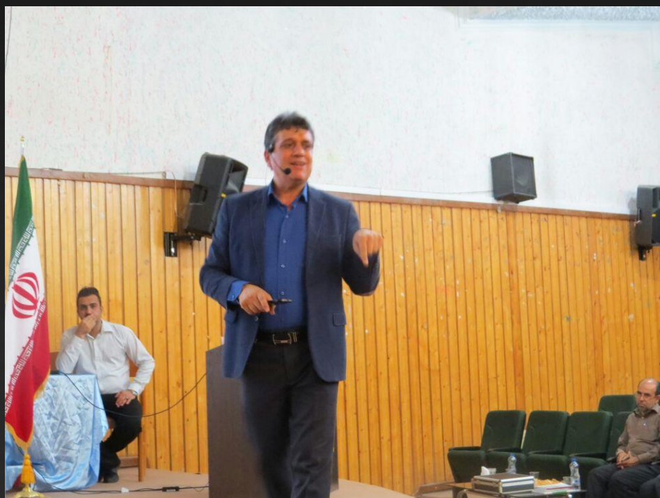
خصوصیات یک کارآفرین