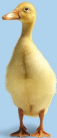
تپلی بیست و یک روزه