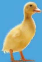
تپلی هفت روزه