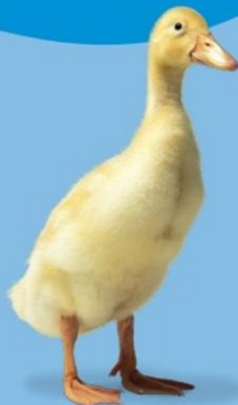
تپلی چهارده روزه