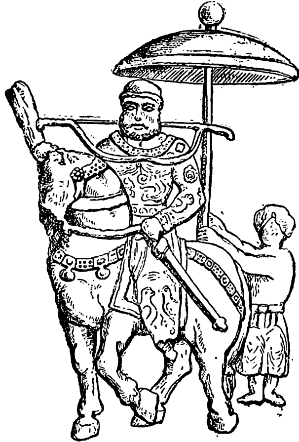
خسرو پرویز و شبدینز .