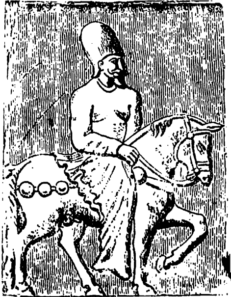
یک نفر از سواران زره پوتی ساسانیان .

روز افزون دادی - کفتم در گیتی بس خوشبختم - لیک این زیبائی مایه بربادی من با کشور بد! ( زخم شاه را می بوسد ) آه چکنم دادارا ؟ آن به منم اکنون در پای کسی میرم گوا ایندم پیشم بهرم به برم مردانه تن از جان پرداخت . ( خنجر را از قلب شاه بیرون میاورد ) ای خنجر خونین کز جانانم جان بربودی ( خنجر را می بوسد ) جان در دم برانت بسپارم تا با جانانش ایندم پیوندی . ( خنجر را بزمین میگذارد و خود را بر آن می اندازد ) شاهنشاهها - جانا - یارا بنگر - بنگر چونان شیرینت بتو می پیوندد . . . . .