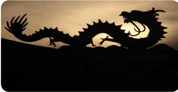
عکس پنجم اژدها

هوا که وقتی ذراتش گرد هم می آیند غلیظ می شوند و به صورت ابر در می آیند و وقتی ذرات از هم جدا می شوند لطیف می شوند و دیده نمی شوند